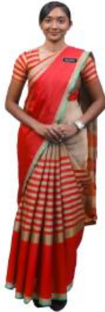
4. Pakaian Sari