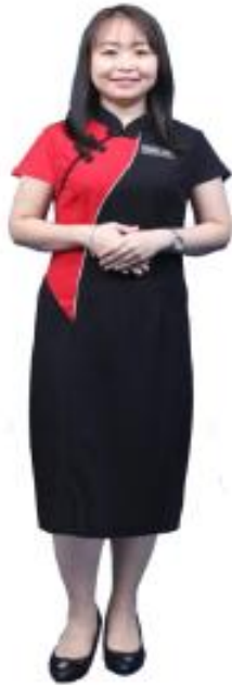
3. Pakaian Ceongsam