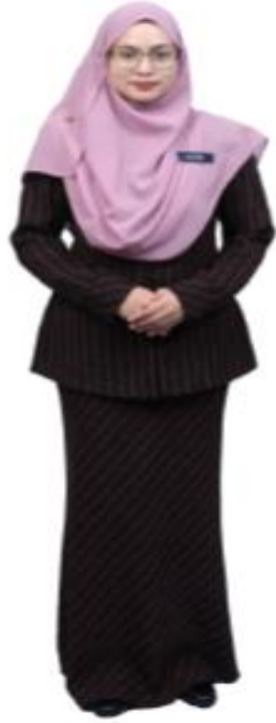
7. Sut dua helai ( Two-piece suit )